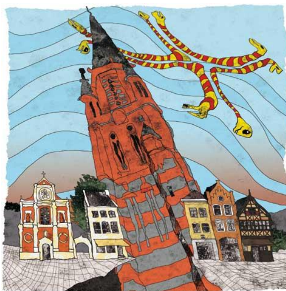
Cees Alfrink (Markt van Sittard)