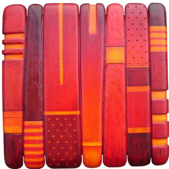
Dimitri Pichelle (Plasticien)