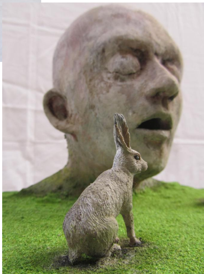
Marc Janssens Leftovers 2